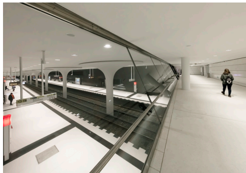
10 In den Bereichen mit niedrigen Deckenhöhen kommen WE-EF DOC220 mit 12 LED und symmetrisch mediumstrahlenden Optiken zum Einsatz.

Juni 2021 / Abdruck honorarfrei / Beleg erbeten / Weitere Informationen: