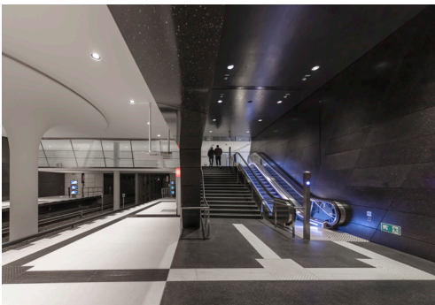
09 Auf die unterschiedlichen Deckenhöhen von Halle und Zwischenebenen reagierten die Planer mit entsprechend angepassten Leuchtenleistungen und Abstrahlwinkeln.