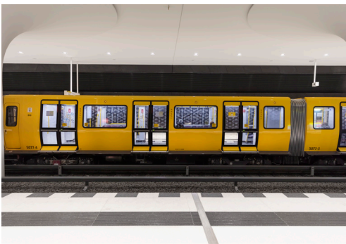
07 Über den Bahnsteigen sind insgesamt 70 WE-EF Einbauleuchten des Typs DOC240 mit 24 LED in warmweiß (3000 K) und einer Anschlussleistung von max. 48 W montiert.