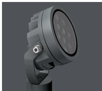
04 Le projecteur FLC230-CC à LED a reçu le label « Winner » au concours du German Design Award 2018, ainsi qu'une « Special Mention » au Focus Open 2017.