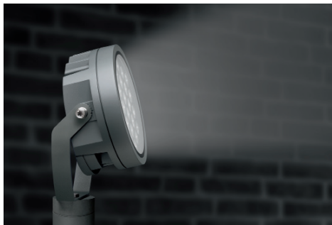
01 Focus Open 2017 : le projecteur FLC240 LED de WE-EF a remporté le Focus Gold dans la catégorie Architecture.