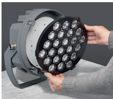
03 D'autre part, le jury a estimé que le concept technique – un système optique sophistiqué à microlentilles qui élimine la lumière parasite et génère une luminance uniforme avec différentes caractéristiques de rayonnement – constituait lui aussi un aspect essentiel de qualité.