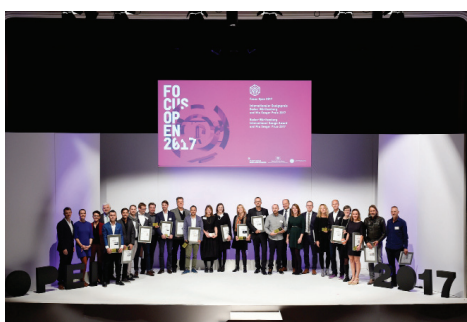
05 Au concours Focus Open 2017, le label exclusif « Gold » n'a été décerné que 13 fois. La cérémonie de remise des prix s'est déroulée le 13 octobre dernier à la Scala de Ludwigsburg.